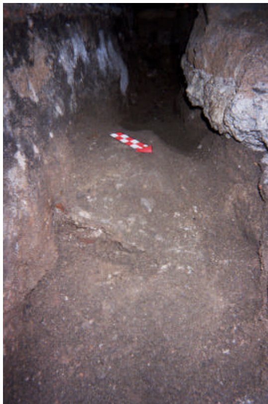
Detall de les UUEE 100, 101 i 104