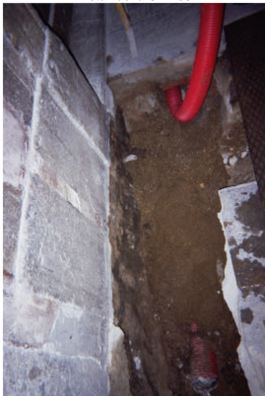
Col·locació del tub per sobre la UE 103