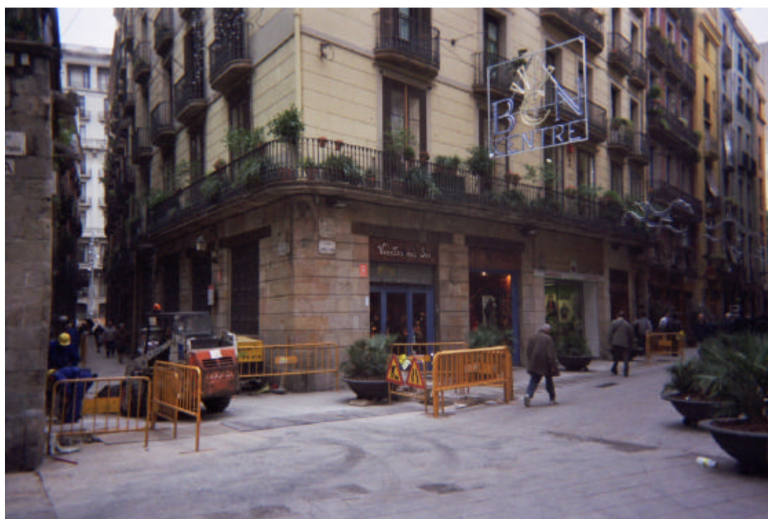
Vista general de la cantonada C/ Argenteria amb Abaixadors.