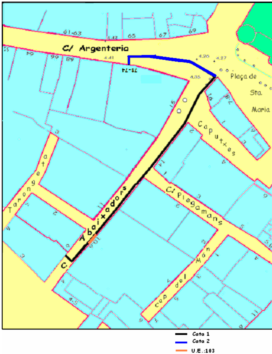
Plànol de situació