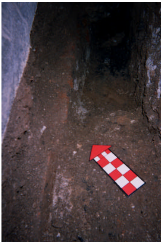
Detall de la UE 103