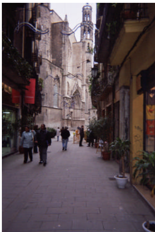
Vista general del C/ Argenteria.