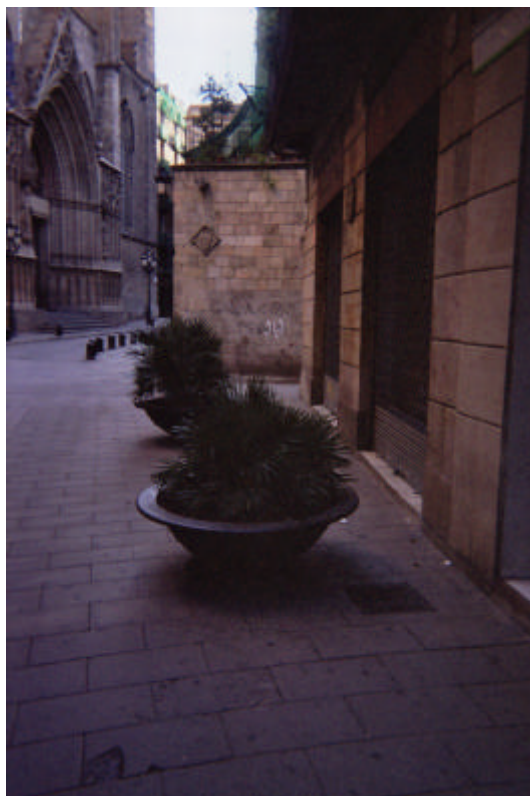
Vista general del C/ Argenteria i Plaça Santa Maria del Mar.