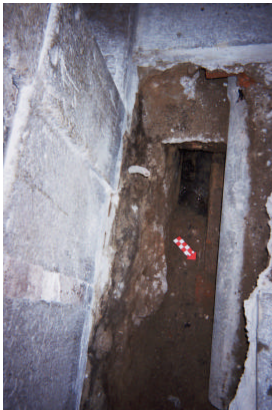
Detall de les UUEE 103 i 104.